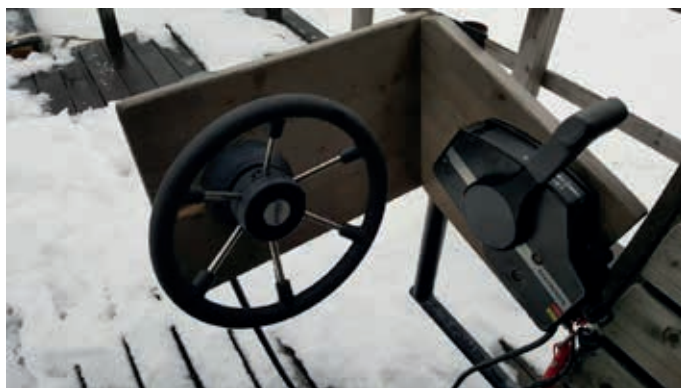
Styrpulpet kopplad till utombordare.