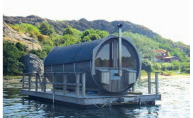
Tillval badlucka i golvet på bastun

Vi hjälper till med att välja en passande modell så att flottens bärkraft blir rätt. Vi är flexibla, anpassningsbara och skräddarsyr lösningen efter önskemål.