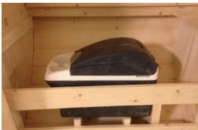
Kylbox infälld under bänk, drivs av solcell och batteri.