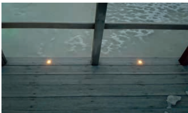
Däckbelysning drivs av solcell och batteri som sitter monterat på bastun.