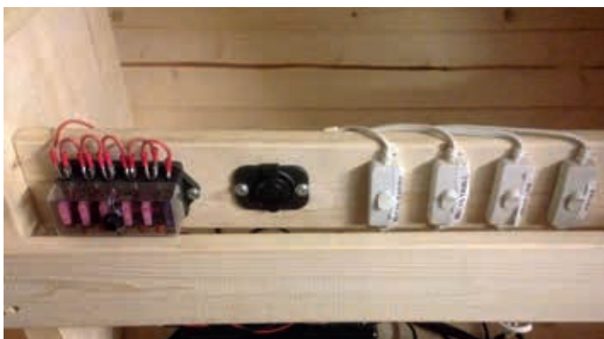
Manövercentral som styr exempelvis: lanternor, däckbelysning duschtunna, bastuns belysning. Sitter monterad under bänken i omklädningsrummet.