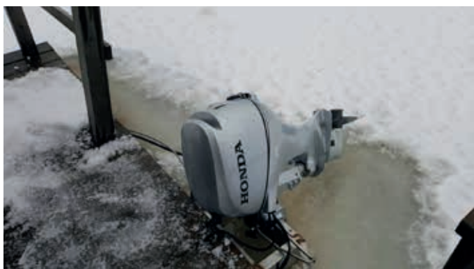
I en insjö räcker det med en 1,5hk elmotor för att köra flotten (motorn på bilden är 15 hk).