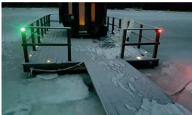
Lanternor och landgång. Landgången finns i olika storlekar, med och utan rektangulära flytblock och fästbeslag.